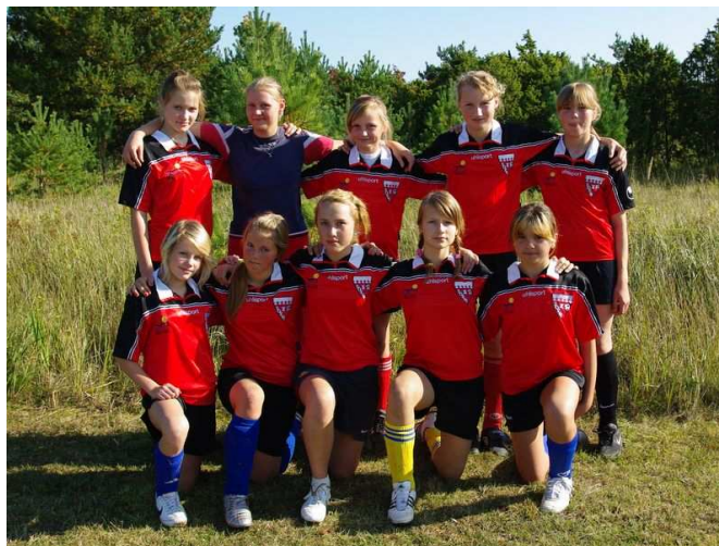
Pildil: Salme kooli võidukad jalgpallitüdrukud

Võistkond esindas Saaremaad koos teisele kohale tulnud Lümanda tüdrukutega vabariiklikus poolfinaalis, mis toimus oktoobri alguses Rapla maal.