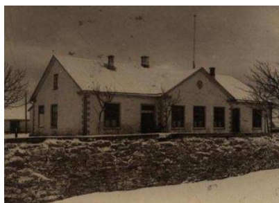
Pildil: Salme vallamaja 1927

Juba mõnda aega on mõlgutatud mõtteid valla muuseumi asutamisest. Sõrvemaal on ju huvitav ja omapärane ajalugu. See on kehvval pinnasel, kahe mere vahel paikneval maalapil elavate inimeste elu lugu. Sõrve on oma geograafilise asukoha ja looduslike iseärasuste tõttu turistidele suurt huvi pakkuv piirkond, mistõttu on siin igal aastal ikka järjest rohkem kaugelt tulnud uudistajaid. Iga külalist huvitab aga looduse kõrval ka inimene, kes oma elu ja tegevusega sellele kandile inimliku sisu annab. Milline