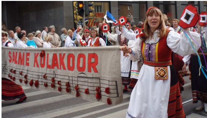
Pildil: Salme külakoos Tallinnas laulupeo rongkäigus